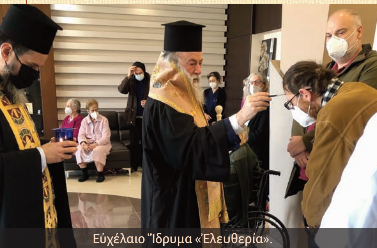
Εὐχέλαιο Ἴδρυμα «Ἐλευθερία».

Τήν 1 ην τόν Ἀγιασμόν εις τό Συνέδριον Ἱστορίας Παγγαίου εις τό Ἀμφιθέατρον τοῦ Δήμου Παγγαίου εις Ἐλευθερούπολιν, τήν 10 ην τό Μυστήριον τοῦ Ἱεροῦ Εὐχελαίου εις τό Νοσηλευτικόν Ἴδρυμα «Ἐλευθερία» εις Νικήσιανην, τήν 12 ην τό μυστήριον τοῦ Ἱεροῦ Εὐχελαίου εις τό Ἴδρυμα Χρονίων παθήσεων εις Ἐλευθερούπολιν.