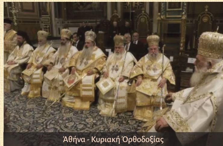
Ἀθήνα - Κυριακή Ὁρθοδοξίας

Τήν 5 ην Κυριακή τῆς Ὁρθοδοξίας Ἀρχιερατικοῦ Συλλειτουργοῦ εἰς τόν ΜητροπολιτικόΝ Ἱερόν Ναόν τῆς Ἱερᾶς Ἀρχιεπισκοπῆς Ἀθηνῶν μετά τοῦ Μακαριωτάτου Ἀρχιεπισκόπου Ἀθηνῶν καί Πάσης Ἑλλάδος κ.κ. Ἱερωνύμου καί τῶν Μελῶν τῆς Διαρκοῦς Ἱερᾶς Συνόδου τῆς Ἐκκλησίας τῆς Ἑλλάδος, τήν 6 ην , 7 ην καί 8 ην τῶν ἐργασιῶν τῆς Διαρκοῦς Ἱερᾶς Συνόδου ὡς Συνοδικός Σύνοδρος.