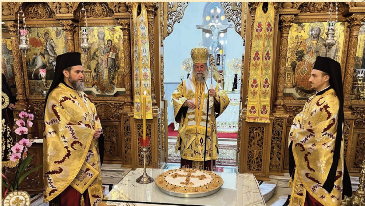
Ν. Ἡρακλείτσα - Μνημόσυνο