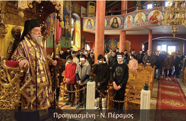
Προηγιασμένη - Ν. Πέραμος