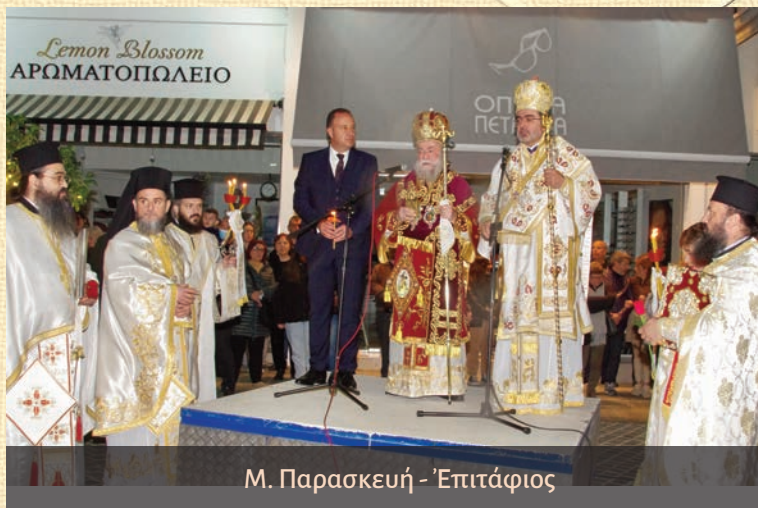
Μ. Παρασκευῇ - Ἐπιτάφιος

τοῦ Ἐπιταφίου εἰς τόν ἹερόΝ Ναόν τοῦ Ἁγίου Ἐλευθερίου, ὅπου καί ὠμίλησε ἀπό ἐξέδρας εἰς τήν Πλατείαν τῆς Πόλεως, τήν 15 η Μέγα