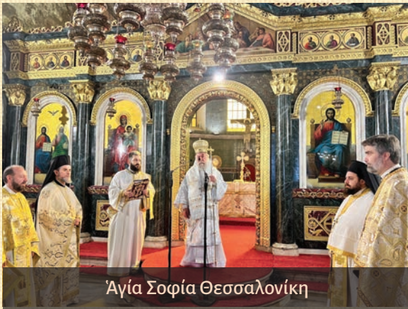
Ἁγία Σοφία Θεσσαλονίκη

Τήν 5 ην εἰς τόν Ἱερόν Ναόν Ἁγίας Σοφίας