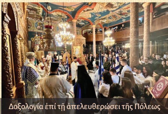
Δοξολογία επί τῆ ἀπελευθερώσει τῆς Πόλεως