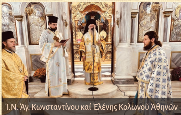
Ἱ.Ν. Ἀγ. Κωνσταντίνου καὶ Ἑλένης Κολωνοῦ Ἀθηνῶν