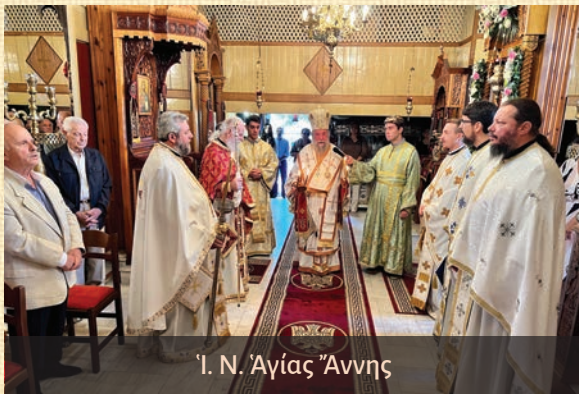
Ἱ. Ν. Ἁγίας Ἄννης

Τὴν 2 α εἰς τὸν Καθεδρικὸν Ἱερόν Ναόν τοῦ Ἁγίου Ἐλευθερίου, τὴν 8 η εἰς τὴν Ἱεράν Μονὴν τοῦ Ἁγίου Παντελεήμονος Χρυσοκάστρου, τὴν 9 η εἰς τὸν πανηγυρίζοντα Ἱερόν Ναόν τῆς Ἁγίας Ἄννης Νικησιάνης,