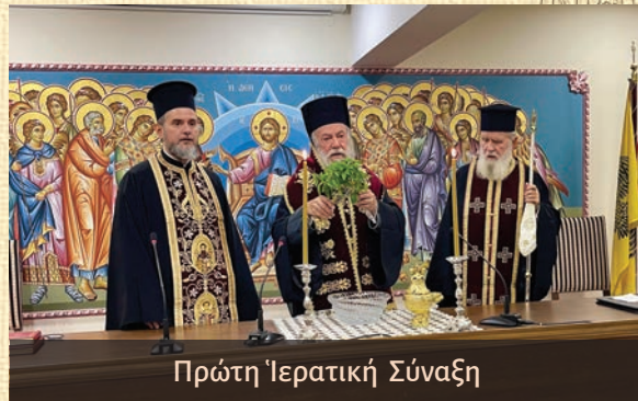
Πρώτη Ἱερατικὴ Σύναξι

Τὴν 17 η τὴν πρώτην μηνιαίαν Ἱερατικὴν Σύναξιν τῆς Κατηχητικῆς περιόδου 2023 - 2024 εἰς τὸ Συνεδριακόν Κέντρον «Ὁ Ἱερός Χρυσόστομος» τῆς Ἱερᾶς Μητροπόλεως, ἀφοῦ προηγουμένως ἐτέλεσε τὸν Ἀγιασμόν,