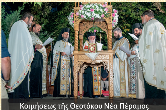
Κοιμήσεως τῆς Θεοτόκου Νέα Πέραμος

Άκολουθίαν τοῦ Μεγάλου Παρακλητικοῦ Κανόνος εἰς τὸν Ἱερὸν Ναὸν Παναγίας Φανερωμένης Νέας Ἡρακλείτσης, τὴν 14 ην εἰς εἰς τὸν Πανηγυρικὸν Ἑσπερινὸν τῆς Κοιμήσεως τῆς Θεοτόκου εἰς τὸ Ἱερὸν Προσκύνημα Παναγίας Φανερωμένης Νέας Περάμου, ὅπου ἐνάλησαν τὰ καθιερωμένα