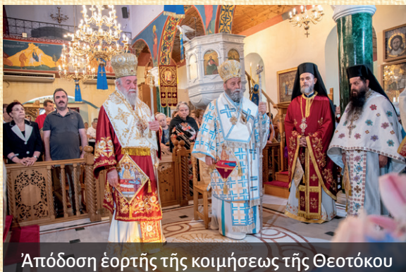
Ἀπόδοσις ἑορτῆς τῆς κοιμήσεως τῆς Θεοτόκου

ἤδη Ἐγκώμια τῆς Παναγίας μας, τὴν 17 ην εἰς τὴν θείαν Λειτουργίαν εἰς τὸν Ἱερὸν Ναὸν τοῦ Ἁγίου Νικολάου Νέας Περάμου, τὴν 22 ην εἰς τὸν πανηγυρικὸν Ἑσπερινὸν εἰς πανηγυρίζοντα Ἱερὸν Ναὸν Παναγίας Φανερωμένης Νέας Ἡρακλείτσης προεξάρχοντος τοῦ Σεβασμιωτάτου Μητροπολίτου Ἰωαννίνων κ.κ. Μαξίμου, ὁ ὁποῖος καὶ ὠμίλησε ἐπικαίρως, τὸ ἀπόγευμα τῆς αὐτῆς ἡμέρας εἰς τὸν μεθεόρτιον ἑσπερινὸν χοροστάτησε ὁ Θεοφιλέστατος Ἐπίσκοπος Τανάγρας κ.κ. Απόστολος. Ἀκολούθησε μεγαλειώδης λιτανεία, ὅπου ἀπὸ ἐξέδρας εἰς τὸ κέντρον τῆς πόλεως ὠμίλησε ὁ Σεβασμιώτατος Μητροπολίτης μας, τὴν 28 ην εἰς τὸν Ἑσπερινὸν τῆς Ἀποτομῆς τῆς Τιμίας Κεφαλῆς τοῦ