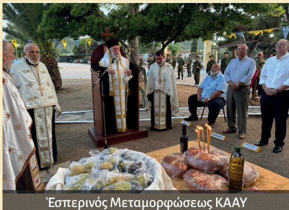
Έσπερινός Μεταμορφώσεως ΚΑΑΥ

Άκολουθίαν τοῦ Μεγάλου Παρακλητικοῦ Κανόνος εἰς τὸν Ἱερὸν Ναὸν Παναγίας Φανερωμένης Νέας Ἡρακλείτσης, τὴν 14 ην εἰς εἰς τὸν Πανηγυρικὸν Ἑσπερινὸν τῆς Κοιμήσεως τῆς Θεοτόκου εἰς τὸ Ἱερὸν Προσκύνημα Παναγίας Φανερωμένης Νέας Περάμου, ὅπου ἐνάλησαν τὰ καθιερωμένα