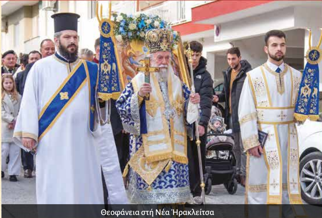
Θεοφάνεια στη Νέα Ήρακλείτσα

υδάτων διά της καταδύσεως του Τιμίου Σταυρού εις τὸν λιμένα τῆς Ν. Ήρακλείτσας, τὴν 11ην εἰς τὸν Ἱ. Ναὸν Ἁγίου Γεωργίου Ἐλαιχωρίου, τὴν 17ην εἰς τὸν πανηγυρίζοντα Ἱ. Ναὸν τοῦ Ἁγίου Ἀντωνίου Πυργοχωρίου, τὴν 18ην εἰς τὸν πανηγυρίζοντα Ἱ. Ναὸν τοῦ Ἁγίου Ἀθανασίου Κάριανης, τὴν 25ην ἐπὶ τῇ ἑορτῇ τοῦ Ἁγίου Γρηγορίου τοῦ Θεολόγου εἰς τὸν Ἱ. Ναὸν τοῦ Ἁγίου Νικολάου Ν. Περάμου, ὅπου καὶ ἐτέλεσεν τὸ ἐξάμηνον μνημόσυνον τοῦ π. Ἱερωνόμου Μαγγάλου.