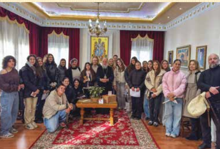
Ἐπίσκεψη μαθητῶν γυμνασίου Ἐλευθερούπολης

Τὰ κάλαντα εἰς τὸν Σεβασμιώτατον ἢ φιλαρμονικὴ τοῦ Δήμου, στρατιῶτες, μαθητὲς, σύλλογοι, σωματεῖα, παιδιὰ τῆς πόλεως καὶ τῶν Ἱερέων μας.