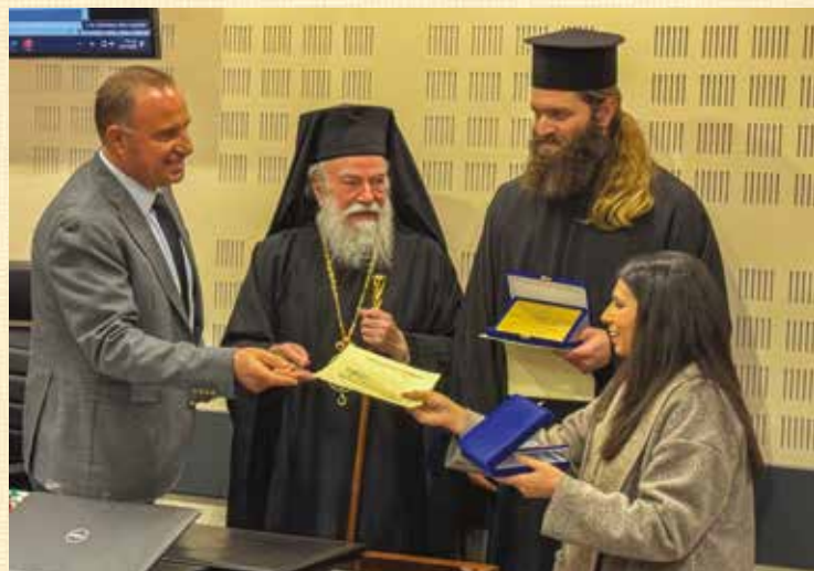
Κοπή Βασιλόπιτας Δημοτικοῦ Συμβουλίου Παγγαίου

ρᾶς Μητροπόλεως μὲ θέμα: «Ἱερότητα τῶν Μυστηρίων καὶ ἡ ἐκκοσμίκευση στὴν ἐκκλησία». Τὴν εἰσήγηση παρουσίασε ὁ Αρχιμ. Ἀρσένιος Μπαρμπαγιάννης Ἀρχιερατικὸς Ἐπίτροπος Ἐλευθερουπόλεως. Ἀκολούθησε εὐρεία συζήτηση καὶ ἐποικοδομητικὸς διάλογος. Πρὶν τῆς εἰσηγήσεως ὁ Σεβασμιώτατος εὐλόγησε τὴν βασιλόπιτα τῶν κληρικῶν τῆς Μητροπόλεως μας.