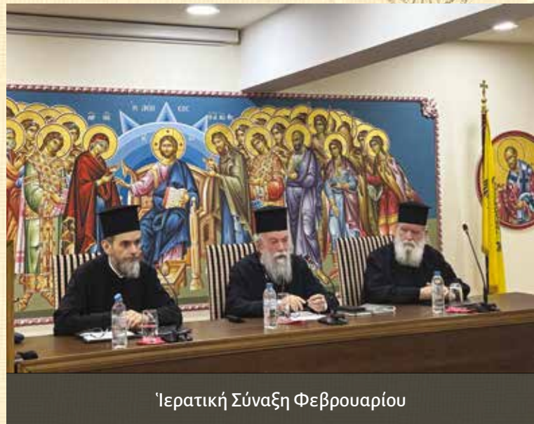
Ἱερατικὴ Σύναξι Φεβρουαρίου