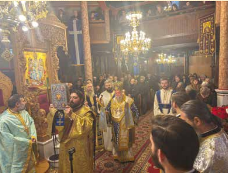
Ἑορτὴ Μητροπολιτικοῦ Ναοῦ Ἁγίου Νικολάου

Τὴν 4ην εἰς τὸν πανηγυρίζοντα Ἱ. Ναὸν Ἁγίας Βαρβάρας Μεσιάς, τὴν 6ην εἰς τὸν πανηγυρίζοντα Μητροπολιτικὸν Ἱ. Ναὸν τοῦ Ἁγίου