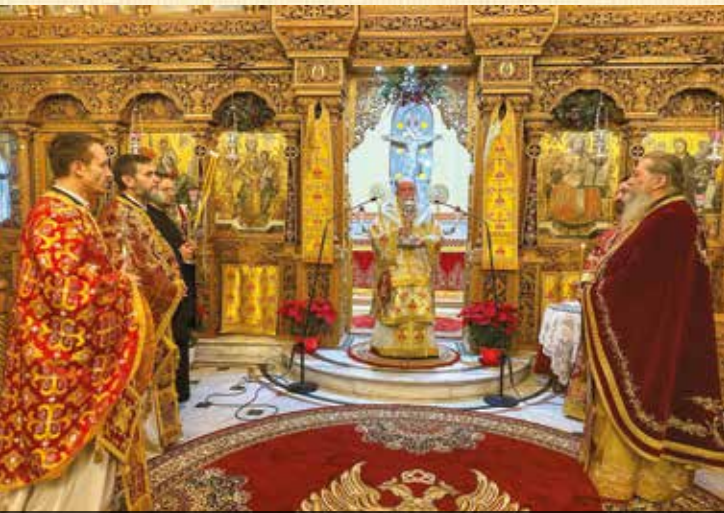
Τοῦ Ἁγίου Χαραλάμπους Νέα Ἡρακλείτσα

Κατὰ τὸν μῆνα Φεβρουάριο 2026 ὁ Σεβασμιώτατος Μητροπολίτης μας κ. Χρυσόστομος: