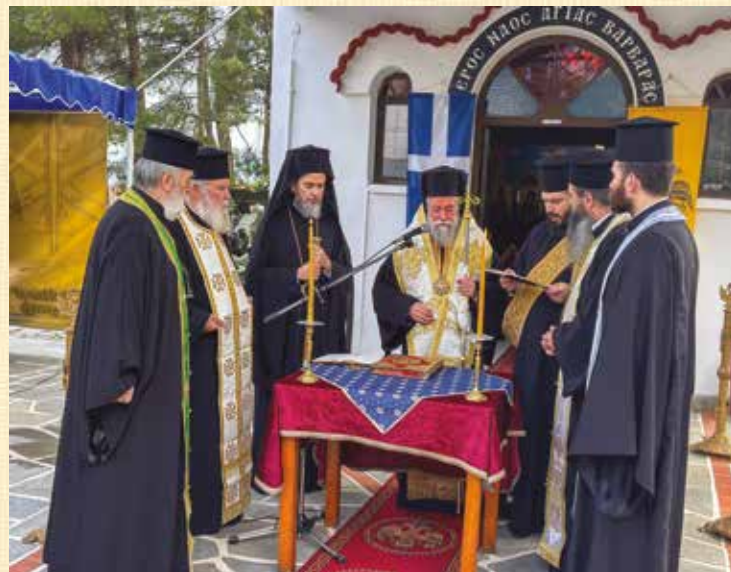
Δοξολογία στό Στρατόπεδο Ἀμβράζη

Τὴν 4ην τῆς Δοξολογίας ἐπὶ τῇ ἑορτῇ τῆς Ἁγίας Βαρβάρας εἰς τὸ Στρατόπεδο «Ἀμβράζη» στὴν