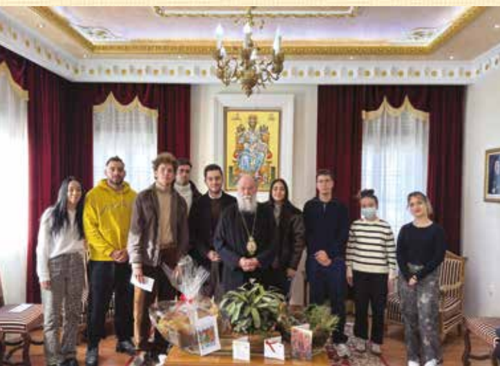
Ἀπονομὴ Ὑποτροφιῶν Μητροπόλεως