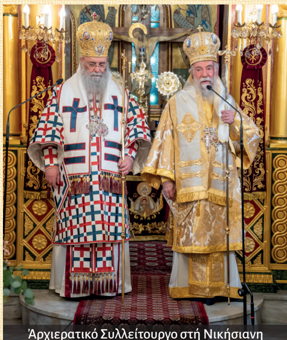
Ἀρχιερατικὸ Συλλείτουργο στὴ Νικήσιανη

Τὴν 1 η Κυριακὴ τῆς Ὁρθοδοξίας, εἰς τὸν Μητροπολιτικὸν Ἱ. Ναὸν τοῦ Ἁγίου Νικολάου Ἐλευθερουπόλεως, ὅπου καὶ προέστη τῆς Λιτανείας τῶν Ἱερῶν Εἰκόνων περὶ τοῦ Ἱ. Ναοῦ, τὴν 7 η ἐπὶ τῇ ἑορτῇ τῶν Ἁγίων Τεσσαράκοντα Μαρτύρων, εἰς τὸν Πανηγυρίζοντα ὁμώνυμον Κοιμητηριακὸν Ἱ. Ναὸν Φωλεᾶς, τὴν 8 η Κυριακὴ Β΄ Νηστειῶν, Ἀρχιερατικὸν Συλλείτουργον μετὰ τοῦ Σεβασμιωτάτου Μητροπολίτου Δράμας κ.κ. Δωροθέου εἰς