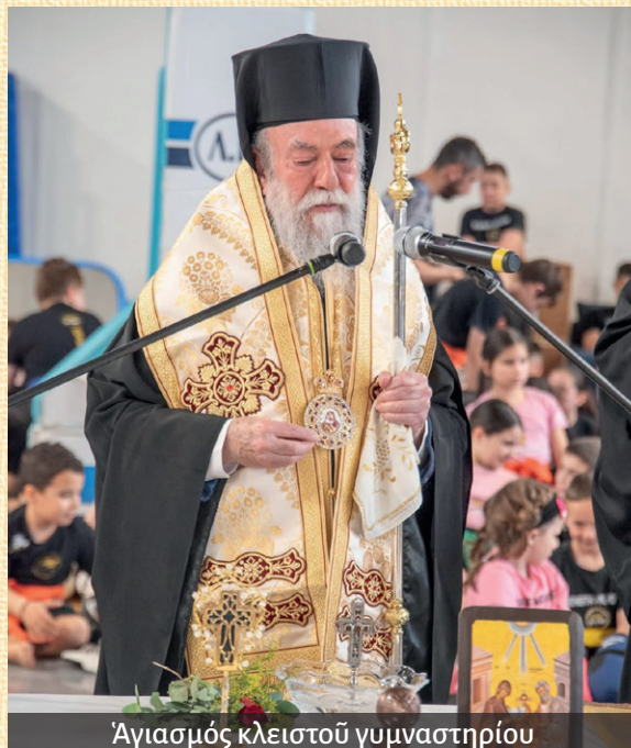
Ἁγιασμός κλειστοῦ γυμναστηρίου