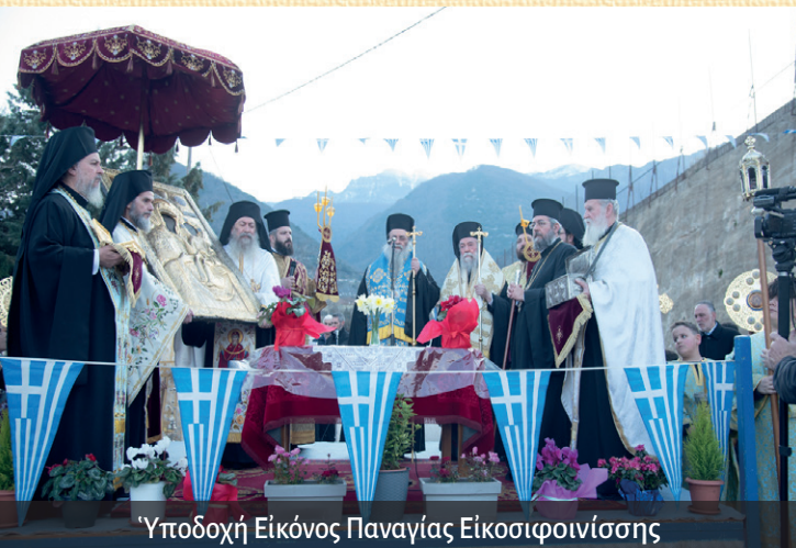
Υποδοχή Εικόνας Παναγίας Εικοσιφοινίσσης

Μητροπολίτου Δράμας κ.κ. Δωροθέου, ὁ ὁποῖος καί ὠμίλησε ἐπικαίρως εἰς τό ἐκκλησίασμα. Ὁ Σεβ. Μητροπολίτης μας εὐχαρίστησε ἐγκαρδίως τόν Σεβασμιώτατο Μητροπολίτη Δράμας καί τήν συνοδεία του, διά τήν πολύτιμον αὐτήν εὐλογίαν πού προσέφεραν εἰς τήν Ἱ. Μητρόπολιν μας. Τήν 25 ην τῆς Δοξολογίας ἐπὶ τῇ Ἐθνικῇ Ἐπετείῳ εἰς τόν Καθεδρικόν Ἱ. Ναόν τοῦ Ἁγίου Ἐλευθερίου καί τῆς Ἐπιμνημοσύνου δεήσεως εἰς τὸ Ἡρώων τοῦ Δημοτικοῦ Πάρκου Ἐλευθερουπόλεως.