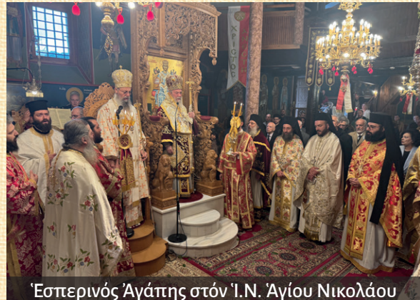
Ἑσπερινός Ἀγάπης στόν Ἱ.Ν. Ἁγίου Νικολάου

Τήν 5 η εις τήν Ἀκολουθίαν τοῦ Νυμφίου εις τήν Ἱ. Μονήν τοῦ Τιμίου Προδρόμου Νικησιάνης, τήν 6 η εις τήν Ἀκολουθίαν τοῦ Νυμφίου εις τόν Ἱ. Ναόν τοῦ Ἁγίου Παντελεήμονος Δρυάδος, τήν 7 η εις τήν Ἀκολουθίαν τοῦ Νυμφίου εις τόν Ἱ. Ναόν τοῦ Ἁγίου Γεωργίου Σιδηροχωρίου, τήν 8 η εις τήν Ἀκολουθίαν τοῦ Ἱεροῦ Εὐχελαιίου εις τό Νοσηλευτικόν Ἰδρυμα «Ἐλευθερία» Νικησιάνης, τήν 9 η εις τήν Ἀκολουθίαν τῶν Ἀχράντων Παθῶν εις τόν Μητροπολιτικόν Ἱ. Ναόν τοῦ Ἁγίου Νικολάου, τήν 10 η Μεγάλην Παρασκευήν το πρῶι, εις τήν Ἀκολουθίαν τῶν Μεγάλων Ὁρῶν καί τοῦ Ἑσπερινοῦ τῆς Ἀποκαθλώσεως, τό ἐσπέρας εις τήν Ἀκολουθίαν τοῦ Ὁρθρου τοῦ Μεγάλου Σαββάτου καί τήν Περιφοράν τοῦ Ἐπιταφίου, εις τόν Ἱ. Ναόν τοῦ Ἁγίου Ἐλευθερίου, ὅπου καί ὠμίλησε ἀπό ἐξέδρας εις τήν πλατείαν τῆς Πόλεως κατά τήν συνάντησιν τῶν Ἐπιταφίων, τήν ἰδίαν ἡμέραν καί ὥραν 15.00 εις τόν «Γολγοθᾶν», τῆς Ἱ. Μονῆς τοῦ Ἁγίου Δημητρίου Νικησιάνης εις τήν Ἀκολουθίαν τῆς Ἀποκαθλώσεως, τήν 11 η Μέγα Σάββατον, εις τόν Ἑσπερινόν καί τήν Θεία Λειτουργία τοῦ Μεγάλου Βασιλείου εις τόν Καθηδρικόν Ἱ. Ναόν τοῦ Ἁγίου Ἐλευθερίου Ἐλευθερουπόλεως, τήν 12 η εις τόν Ἑσπερινόν τῆς Ἀγάπης εις τόν Μητροπολιτικόν Ἱ. Ναόν τοῦ Ἁγίου Νικολάου Ἐλευθερουπόλεως, συγχοροστατοῦντος τοῦ Θεοφιλεστάτου Ἐπισκόπου Τανάγρας κ. Ἀποστόλου, τήν 18 η εις τήν Ἀκολουθίαν τοῦ Ἑσπερινοῦ τοῦ Σαββάτου εις τόν Πανηγυρίζοντα Ἱ. Ναόν Ἀποστόλου Θωμᾶ Παλαιοχωρίου, συγχοροστατῶν μετά τοῦ Σεβασμιωτάτου Μητροπολίτου Γρεβενῶν κ. Δαβίδ,