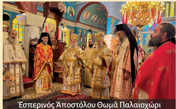
Ἑσπερινός Ἀποστόλου Θωμᾶ Παλαιοχωρί

χοροστατοῦντος τοῦ Θεοφιλεστάτου Ἐπισκόπου Τανάγρας κ. Ἀποστόλου.